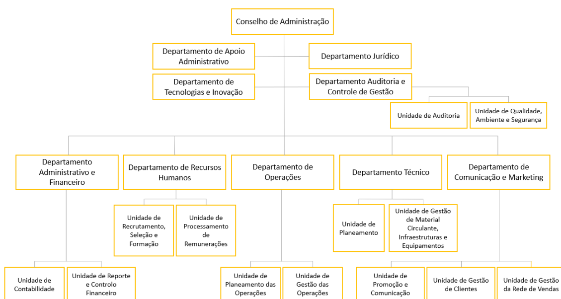
FIGURA 1 - ORGANOGAMA DA METRO MONDEGO, S.A.